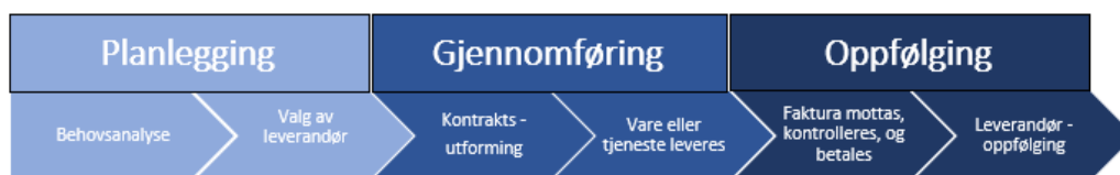
Figur 1: Anskaffelsesprosessen.

Gjennom «Standard for innkjøp i SpareBank 1 SMN» er det etablert et rammeverk ved anskaffelser som skal sikre en helhetlig oppfølging ved anskaffelsesprosessen: